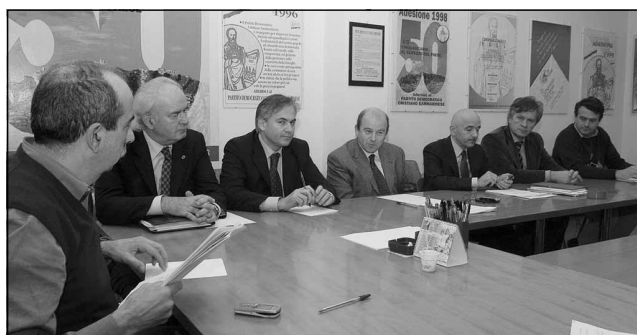
Un recente incontro delle forze di maggioranza